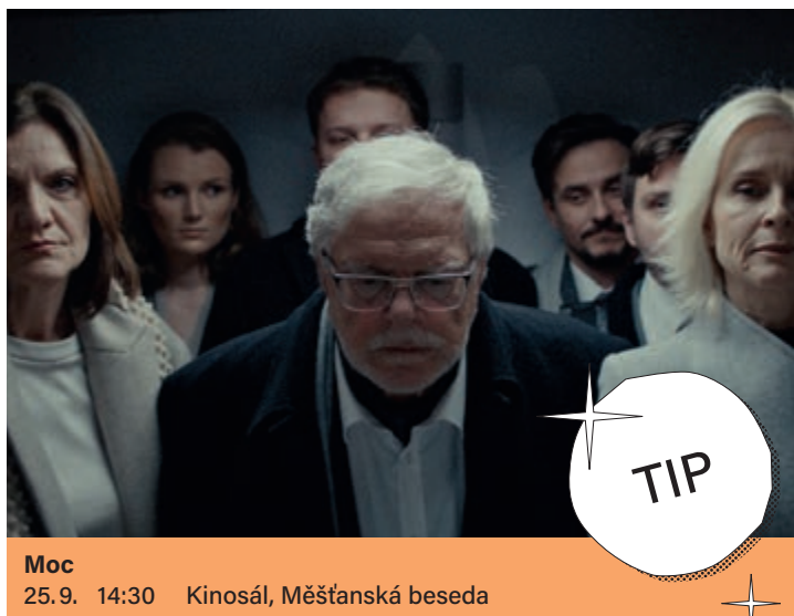
Moc 25.9. 14:30 Kinosál, Měšťanská beseda

bránit jeho medializaci, si zároveň klade otázky o limitech hledání a skrývání pravdy. Co se skrývá za maskami volených reprezentantů, odkrývá drama s prvky politického thrilleru, který je druhým celovečerním počinem režiséra Mátyáse Priklera. Metaforický příběh byl uveden ve světové premiéře na Mezinárodním filmovém festivalu v Rotterdamu.