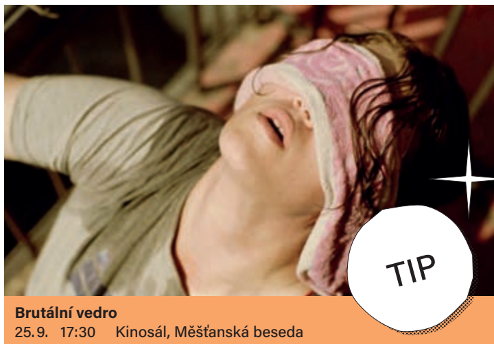
Brutální vedro 25.9. 17:30 Kinosál, Měšťanská beseda