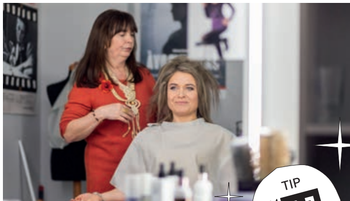
Dobré ráno, Brno!, 1. díl

netové platformy České televize a Novy. Všechny jsou svěží, zábavné a přinášejí nová, mladá témata i jejich neokoukané zpracování.